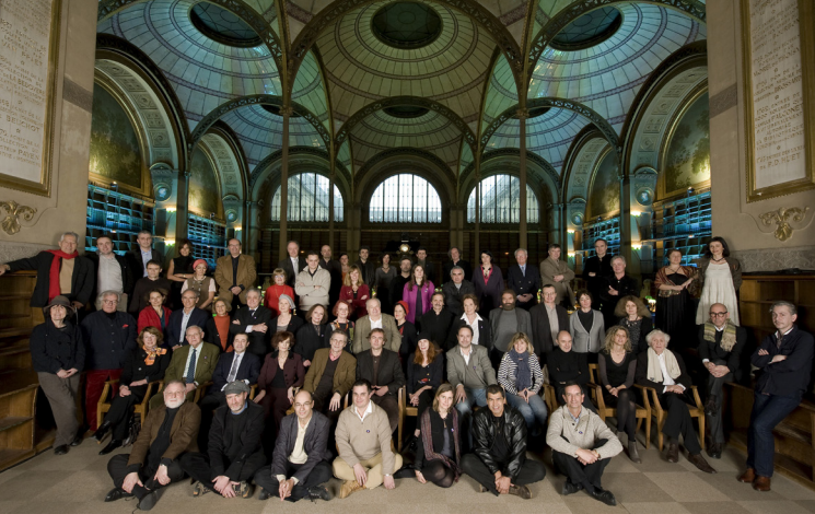
Les écrivains réunis à la BnF Richelieu à l'occasion des 10 ans de Lire et faire lire (2010).