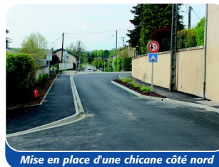
Mise en place d'une chicane côté nord

Débutés en février, les travaux de sécurisation de la route de Sainte-Croix sont en voie d'achèvement. La création d'un trottoir sécurisé et la mise en place de deux chicanes sur la chaussée vont désormais permettre aux piétons d'emprunter la route de Sainte-Croix en toute quiétude. Après le passage du tour de France, l'installation fin juillet de deux coussins berlinois à hauteur des chicanes mettra un point final à ces travaux. ■