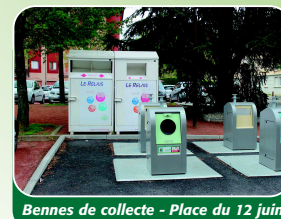
Bennes de collecte - Place du 12 juin

En facilitant le déploiement de la collecte sélective des textiles, la 3CM et la ville de Dagneux répondent aux enjeux du Grenelle de l'environnement, visant à prévenir l'augmentation continue des volumes de déchets ménagers et à préserver les ressources naturelles. Les textiles, linges et chaussures collectés par l'organisme «Le Relais» sont ensuite recyclés (en chiffon ou en isolant) ou réemployés (revente dans des boutiques et export).