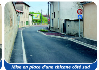
Mise en place d'une chicane côté sud